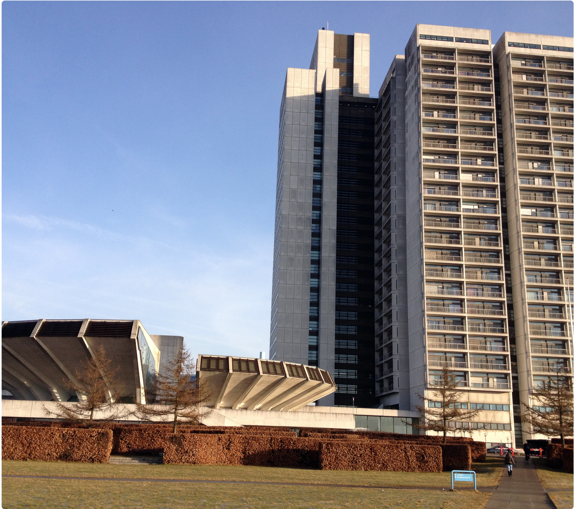
Herlev Hospital - set fra parkeringspladsen.