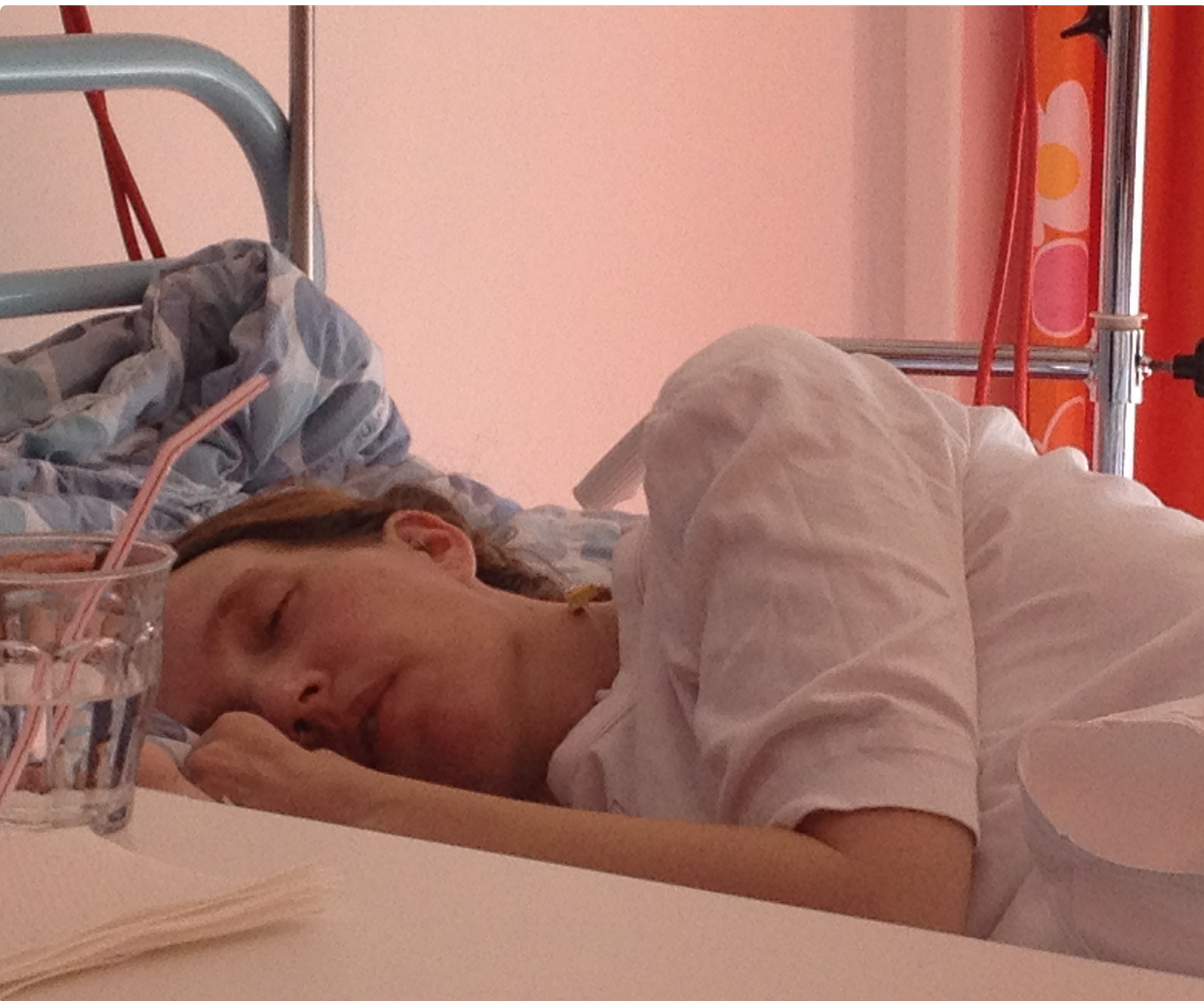
Mette hviler sig.